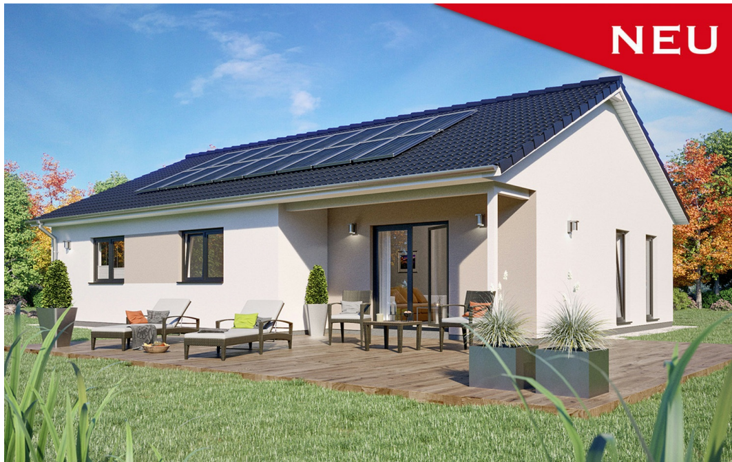
Bungalow: SH 117 B - Var. A mit Satteldach

https://www.scanhaus.de/fertighaeuser/bungalows/sh-117-b