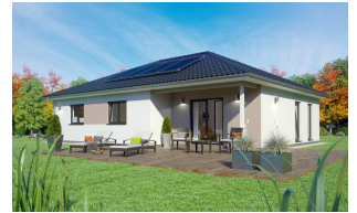
Bungalow: SH 117 B - Var. A mit Walmdach