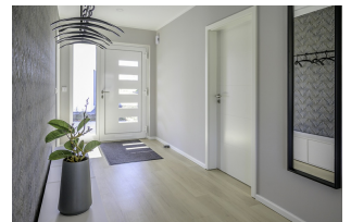
Bungalow: SH 117 B - Var. A1 | Flur