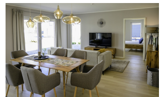
Bungalow: SH 117 B - Var. A1 | Ess- und Wohnbereich