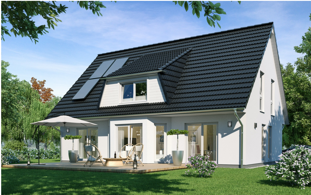
Fertighaus 1,5-Geschosser SH 180 - Var. D

https://www.scanhaus.de/fertighaeuser/15-geschosser/sh-180-variante-d