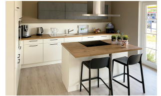
Fertighaus 1,5-Geschosser SH 180 - Var. D Küche