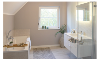
Fertighaus 1,5-Geschosser SH 180 - Var. D Bad